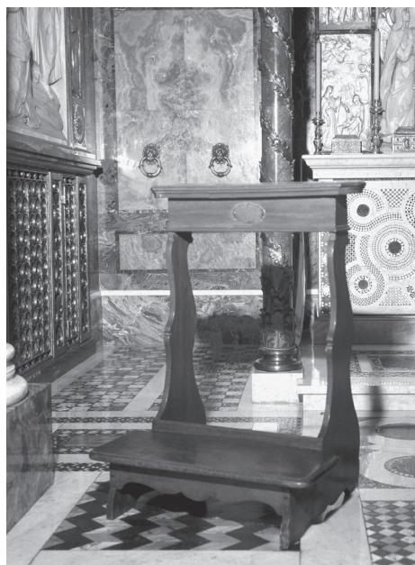
Genuflexório utilizado por Pio X. Actualmente se conserva em Roma, no Oratório da Santíssima Trindade da sede central do Opus Dei.