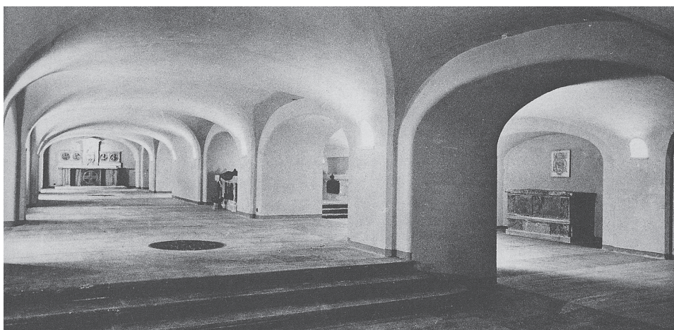
Vista da Nave central da Cripta dos Papas, em 1949, depois da conclusão das obras de remodelação. No extremo ocidental da nave vê-se o altar de Cristo Rei, dentro do qual esteve a urna com o corpo de Pio X entre os dias posteriores à sua beatificação e o mês de dezembro de 1951. Em 17 de fevereiro de 1952 a mesma urna foi colocada dentro do altar da Capela da Apresentação, onde permanece ainda hoje. No lugar onde então se encontrava o altar de Cristo Rei, agora pode ver-se uma parede de vidro que permite aos peregrinos a visão do Túmulo de São Pedro e da arca dos pálios.