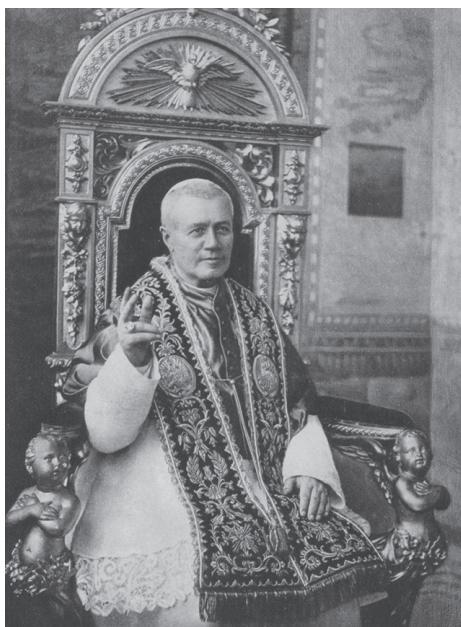
São Pio X ocupou a Sede de Pedro desde o dia 9 de agosto de 1903 até ao dia 20 de agosto de 1914.