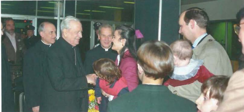
• L'ultima foto di don Álvaro il 22 marzo 1994: al suo rientro dalla Terra Santa ha avuto la lieta sorpresa di incontrare alcune famiglie che lo attendevano a Ciampino.

umana”– è l’ambito in cui l’uomo è amato per se stesso e impara a vivere “il dono sincero di sé” (n. 11). Quindi, la famiglia in quanto scuola di amore: a patto, però, che sappia conservare la propria identità, e cioè una comunità stabile di amore fra un uomo e una donna, fondata sul matrimonio e aperta alla vita. Quando vengono meno l’amore, la fedeltà o la generosità verso i figli, la famiglia si sfigura. E le conseguenze non si fanno attendere: per gli adulti, la solitudine; per i figli, l’abbandono; e per tutti, la vita diventa un territorio inospitale. Per questo, conclude Giovanni Paolo II, “nessuna società umana può correre il rischio del permissivismo in questioni di fondo concernenti l’essenza del matrimonio e della famiglia” (n. 17): parole che non sono profezia, ma constatazione. Il Santo Padre convoca tutte le famiglie, anche quelle che si trovano in difficoltà, perché siano fedeli alla propria vocazione di servizio alla vita e alla piena umanità dell’uomo, fondamento di una civiltà dell’amore.