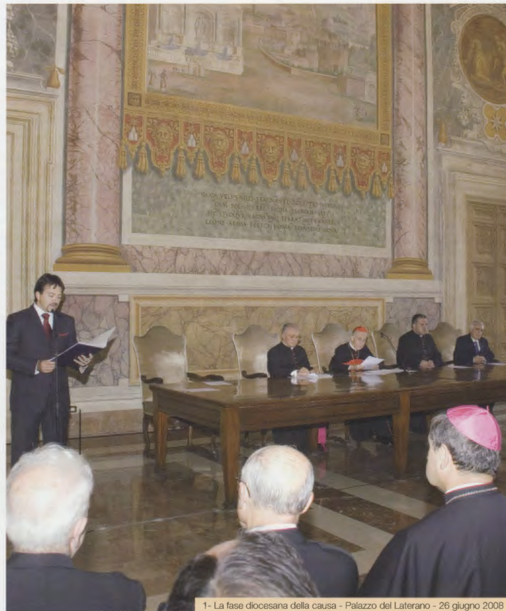
1- La fase diocesana della causa - Palazzo del Laterano - 26 giugno 2008