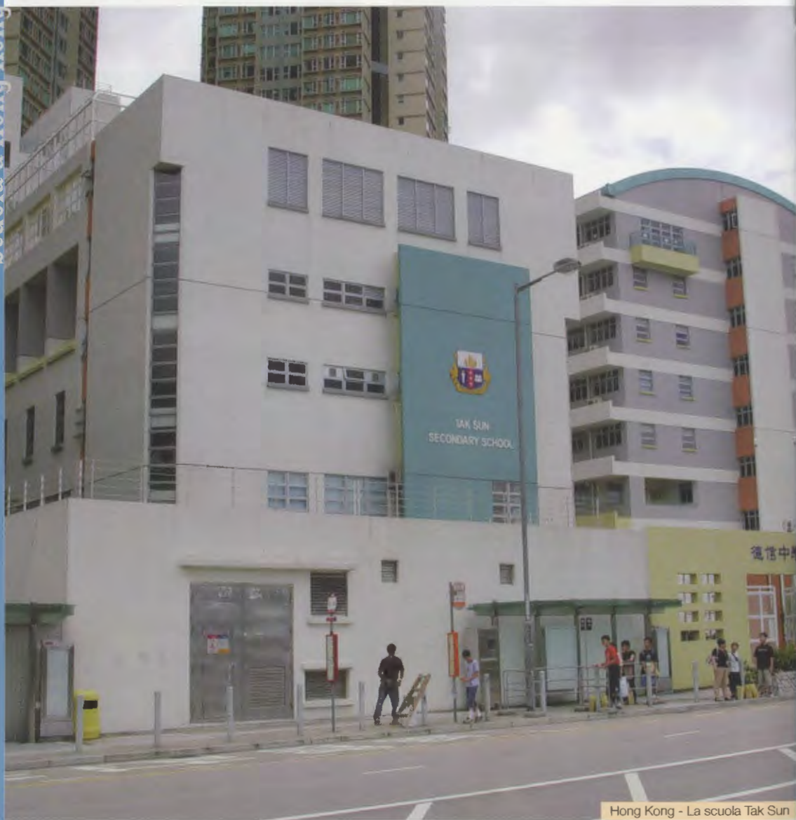
Hong Kong - La scuola Tak Sun