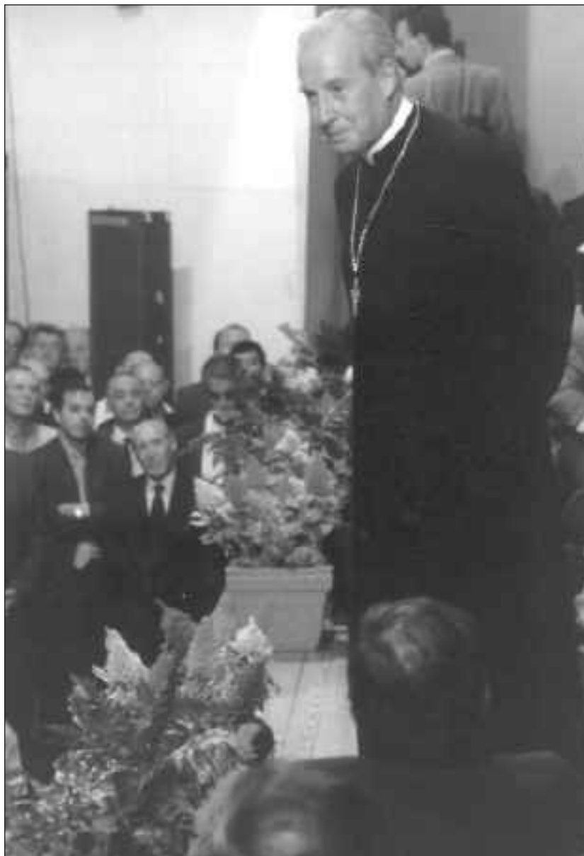
Monseñor Echevarría, Prelado del Opus Dei , en uno de sus encuentros con miembros de la Prelatura

● y una actitud positiva y abierta ante la trans-