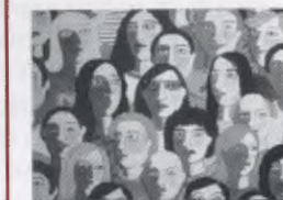
Jornada Crisi Econòmica i Crisi Moral

«Què pot aportar un moviment social cristià d'alliberament»