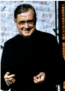
Saint Josémaría à Séville, Espagne, 1974.

Josémaría Escriva naît le 9 janvier 1902 à Barbastro (Espagne). Ordonné prêtre à Saragosse le 28 mars 1925, il « voit », selon son expression, l'Opus Dei, le 2 octobre 1928. Dès lors, il commence son travail avec des jeunes dans les hôpitaux et les quartiers pauvres de Madrid. Parallèlement, il donne des cours pour subvenir aux besoins de sa famille, à sa charge depuis la mort de son père. En 1946, afin de souligner le caractère universel de l'Opus Dei, mais aussi pour fuir les éventuelles pressions du gouvernement de Franco, il s'installe à Rome. Il y meurt le 26 juin 1975 : l'Œuvre est alors présente sur les cinq continents et compte plus de 60 000 membres. Le 6 octobre 2002, Jean-Paul II canonise celui que l'on nomme désormais saint Josémaría.