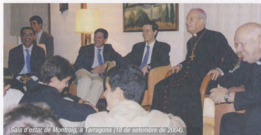
Sala d'estar de Montroig, a Tarragona (18 de setembre de 2004).

El dia 20, després de l'esmorzar, surt en avió cap a Roma.