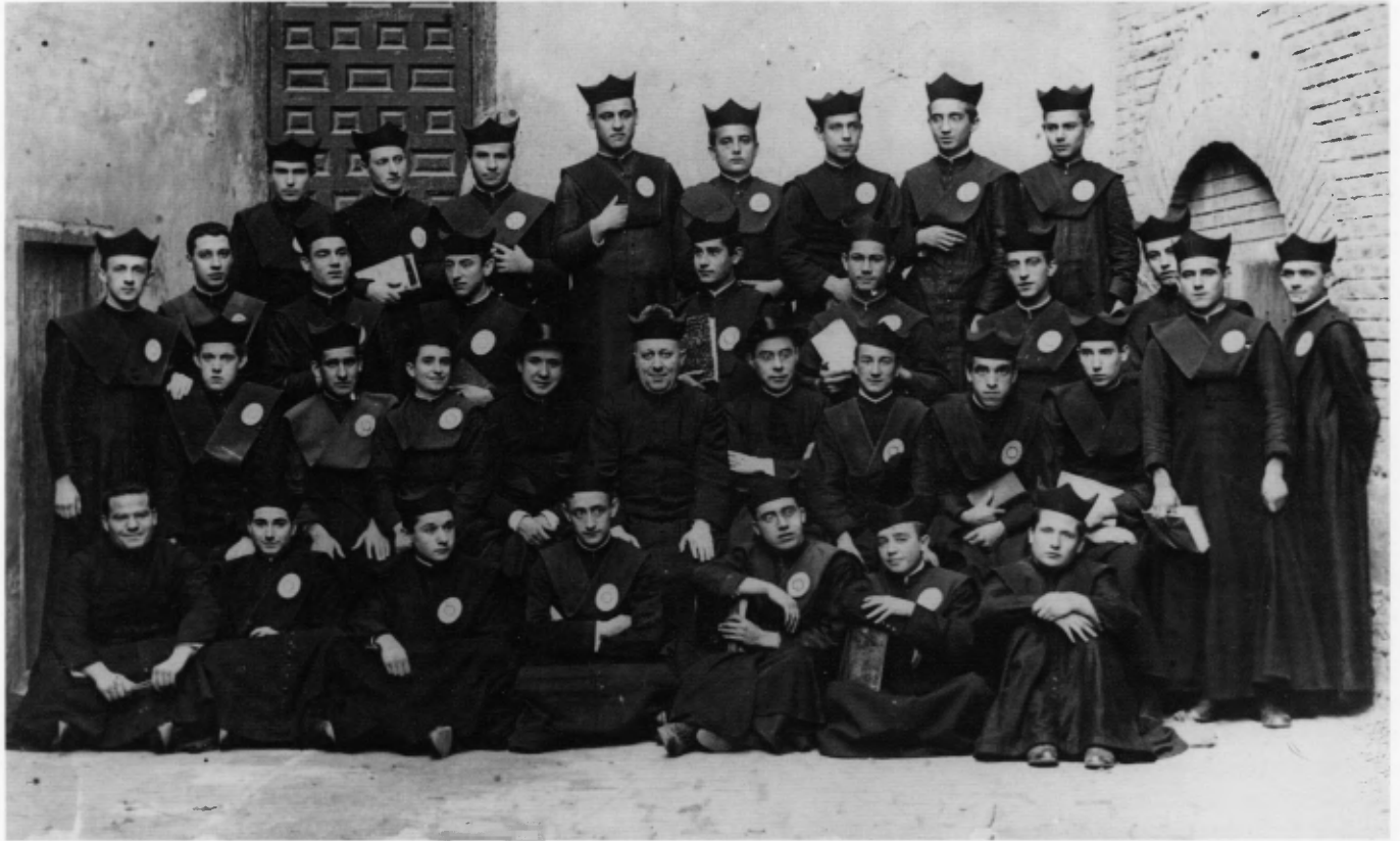
Saint Josemaría in Zaragoza during his Seminary years, 1922

Similarly, work continued for the preparation of new volumes of the collection of complete works, as well as the work for the third initiative undertaken by the Institute: a collection of monographs.