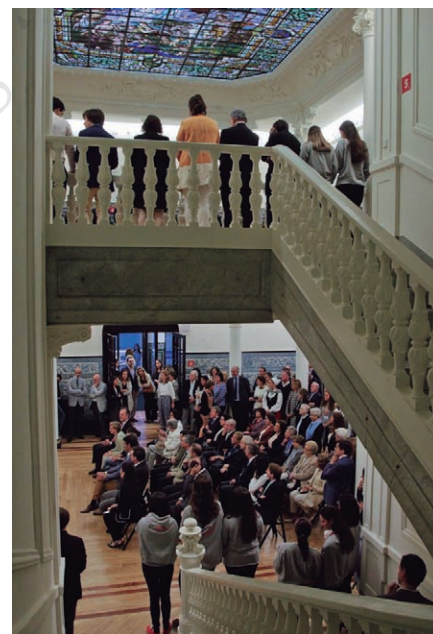
Tras un arresku de bienvenida, el evento prosiguió en el vestíbulo.