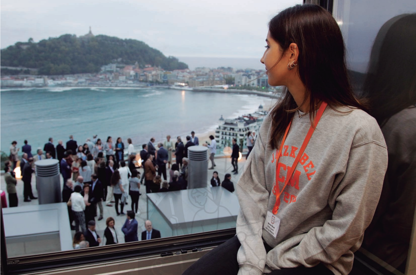
Un grupo de alumnos del Conservatorio Superior de Música del País Vasco-Musikene amenizó el acto de inauguración.