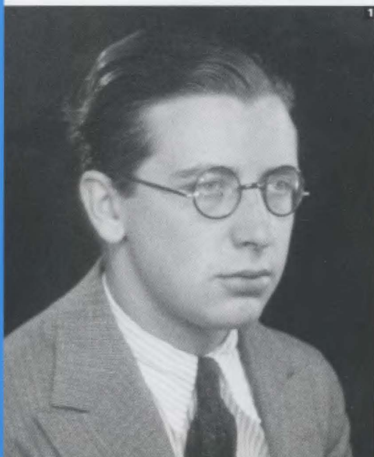
1 Blaženi Álvaro leta 1937.

»Álvaro del Portillo je te naloge opravljal v krščanskem duhu, kot izražajo besede, s katerimi se je leta pozneje spominjal tega dela: 'Vedno sem se od njih učil: ti ljudje niso imeli kaj jesti, a drugega pri njih nisem videl kot veselje. Zame so bili izjemna lekcija'«. ■