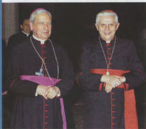
• Mit Kardinal Joseph Ratzinger (1987).

Der Ruf der Heiligkeit, in dem der Diener Gottes schon zu Lebzeiten in breiten Kreisen stand, hat sich nach seinem Tod weltweit verbreitet. Von 2004 bis 2008 fanden zwei gleichrangige Prozesse über das Leben, die Tugenden und den Ruf der Heiligkeit des Dieners Gottes statt – am Gericht des Vikariats der Diözese Rom und an demjenigen der Prälatur. Außerdem wurden acht Rogatorialverfahren in verschiedenen Diözesen Europas, Nord- und Südamerikas sowie Australiens durchgeführt. In einer Sondersitzung der theologischen Konsultoren vom 10. Februar 2012 wurde die Frage nach