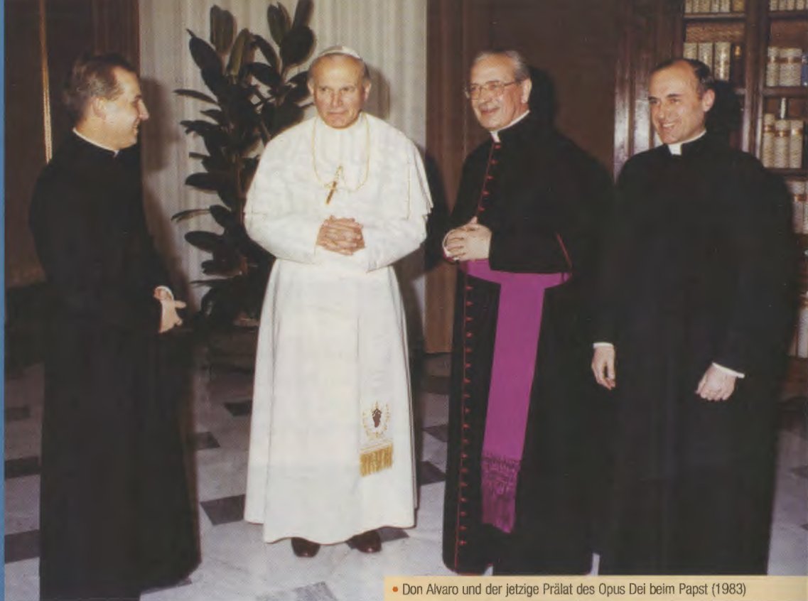
• Don Alvaro und der jetzige Prälät des Opus Dei beim Papst (1983)

war es, die endgültige Rechtsform für das Opus Dei zu erreichen, so wie sie der Gründer gewünscht und auch schon vorbereitet hatte.