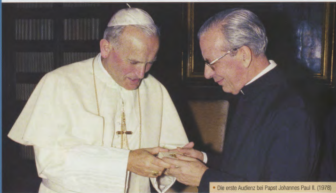
• Die erste Audienz bei Papst Johannes Paul II. (1978)