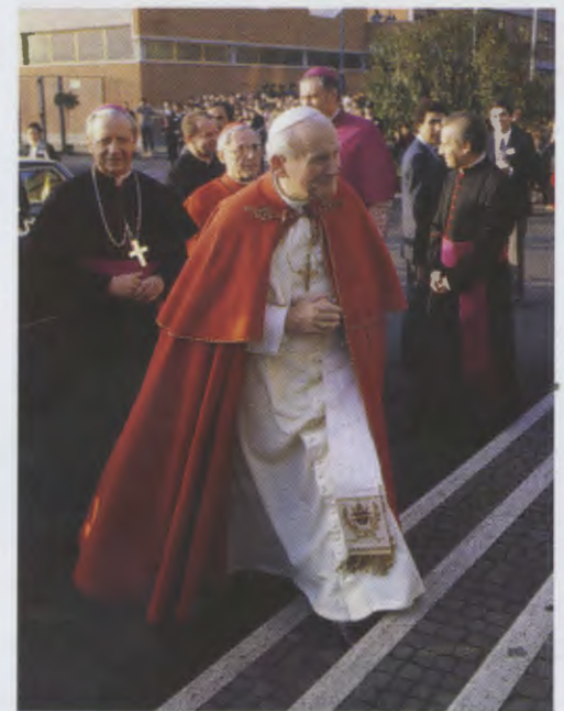
• Der Papst im Fortbildungszentrum ELIS (1984)

Als Prälät Echevarría ihm im Namen des Opus Dei für diesen Beweis großen Wohlwollens dankte, erwiderte Johannes Paul II. auf italienisch, dass er es als seine Pflicht ansah: „Si doveva, si doveva...“ (Ich musste es doch tun...).