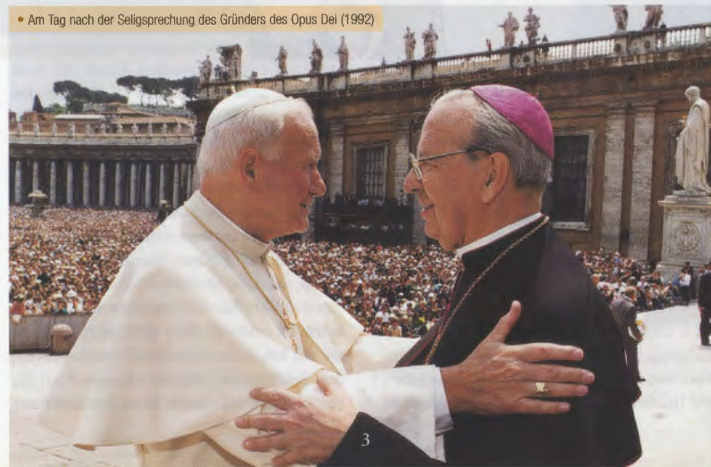
• Am Tag nach der Seligsprechung des Gründers des Opus Dei (1992)

und effektive Einheit mit dem Papst die unerlässliche Bedingung für das Leben und die apostolische Wirksamkeit der Kirche ist. Christus hat das mit aller Klarheit gesagt: Wie die Rebe aus sich keine Frucht bringen kann, sondern nur, wenn sie am Weinstock bleibt, so könnt auch ihr keine Frucht bringen, wenn ihr nicht in mir bleibt (Joh 15, 4). Und um in Christus zu bleiben, bedarf es unbedingt der ungebrochenen Einheit mit dem Papst, seinem Stellvertreter auf Erden.“ Das leuchtende Beispiel seiner großen Liebe zum Heiligen Vater hat vielen Christen geholfen, mit diesem in kindlicher Zuneigung verbunden zu sein. Unermüdlich sprach er in seiner Verkündigung über dieses Thema: „Aus Liebe zum Nachfolger Petri müssen wir sehr römisch sein. Das zeigt sich in Gebet und Opfer für seine Person und seine Anliegen, in der Treue, mit der wir zu seinem Lehramt stehen, und im Gehorsam, mit dem wir seine Weisungen befolgen.“ ▲