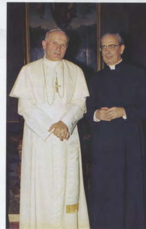
• Eine Ansichtskarte aus Jerusalem an den Sekretär des seligen Johannes Paul II. • Die erste Audienz beim Papst (1978)