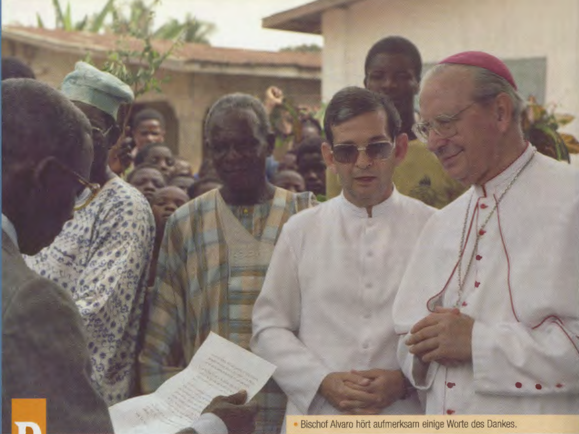
• Bischof Alvaro hört aufmerksam einige Worte des Dankes.