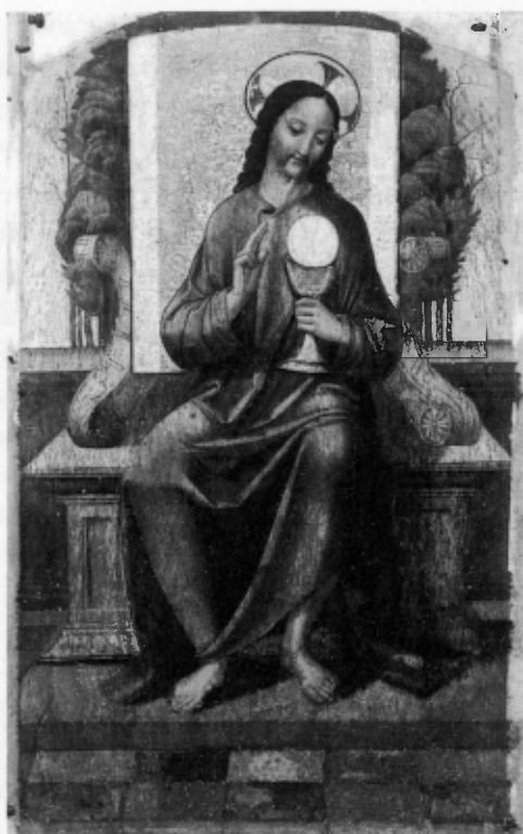
Cristo eucarístico. Maestro de Martín Miguel. Primera mitad del siglo XVI. Iglesia de San Bartolomé. Martín Miguel (Segovia). (AA.VV., El árbol de la vida. Las edades del hombre, Catedral de Segovia 2003, p. 457).

Sostiene el Papa que la solicitud por los necesitados es nada menos que campo de prueba o criterio de verificación del proyecto eucarístico. En el servicio de los últimos “se refleja en gran parte la autenticidad de la participación en la Eucaristía celebrada en la comunidad: se trata de su impulso para un compromiso activo en la edificación de una sociedad más equitativa y fraterna ” 50 . Se refiere concretamente a los diversos ámbitos de las “múltiples pobreza” de nuestro mundo: el hambre, la soledad, el paro, etc., invitando a las comunidades cristianas a una mayor sensibilidad a este respecto.