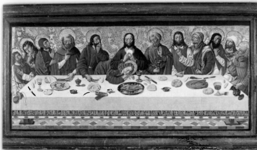
La Última Cena. Maestro de la Visitación de Palencia. H. 1490-1495.

Iglesia de san Esteban. Museo del Retablo. Burgos.