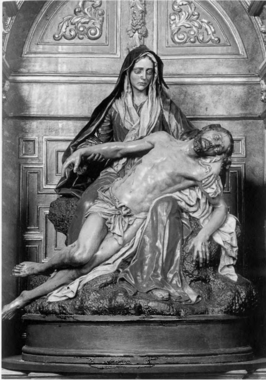
La Piedad. Luis Salvador Carmona, año 1750. Iglesia de San Martín, León. (AA.VV. El árbol de la vida. Las edades del hombre, Catedral de Segovia 2003, p. 353).