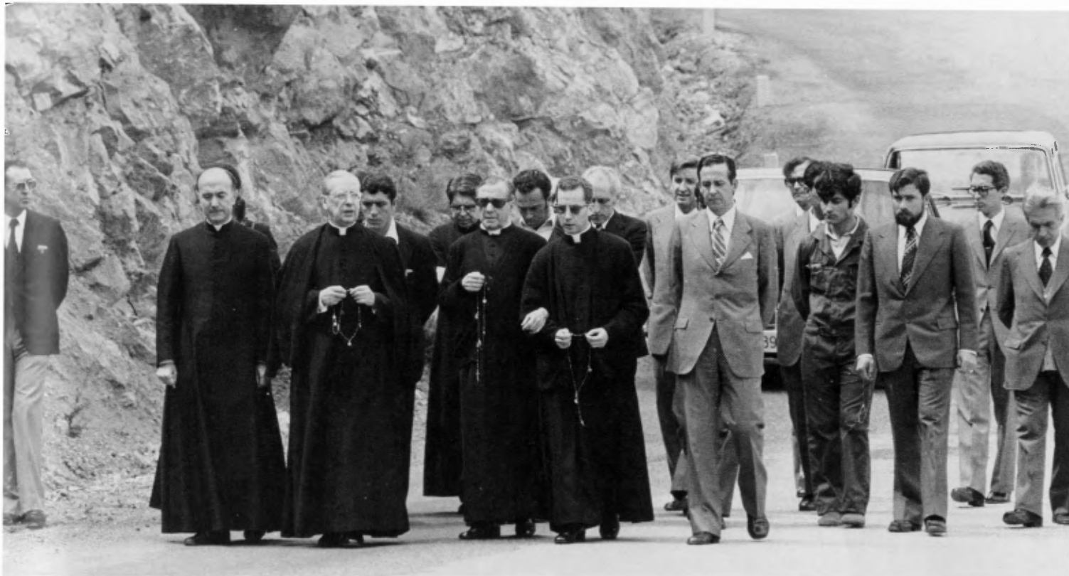
Romería desde el Crucero, mayo de 1975.

de Torreciudad, quiso sumarse con amor y gratitud el Fundador del Opus Dei. Tal es la razón de que, bajo su impulso espiritual, se pusieran los medios para levantar allí un Santuario destinado a ser digna morada de la imagen de Nuestra Señora, tras una cuidadosa restauración que devolvió a la vieja talla románica su genuina y bellísima forma originaria.