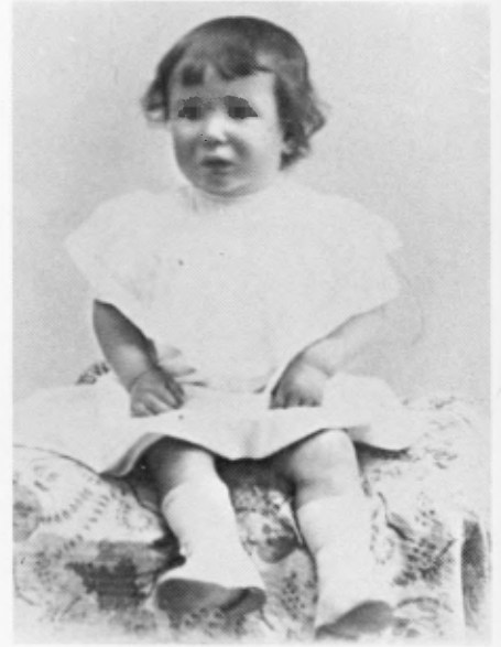
Primera fotografía que se conserva de Mons. Escrivá de Balaguer. Tenía poco más de un año.