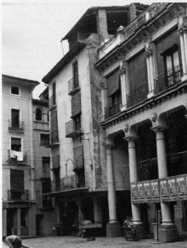
Casa natal del Fundador del Opus Dei, en la plaza del Mercado, Barbastro.

El día siguiente, 21 de octubre, era domingo y decidimos hacer una «descubierta» en busca de Torreciudad. En el mapa de Asso aparecía —como decimos— la aldea de Bolturina y en las cartas actuales podía verse que hasta allí llegaba un camino de tierra, que arrancaba de la carretera de Barbastro a Graus. Bolturina en 1956 contaba todavía con algunos vecinos. Llegamos hasta el lugar en automóvil y comprobamos que allí moría, efectivamente, el camino vecinal. Al oír el insólito ruido del motor de un coche, una mujer anciana salió de su casa y a ella nos dirigimos para que nos orientase