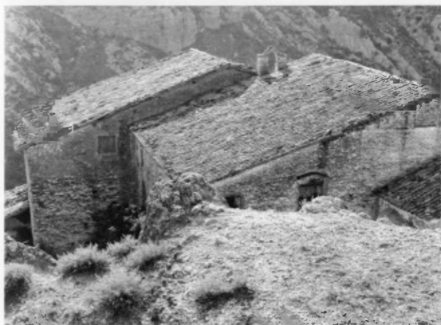
Exterior e interior de la ermita el 21 de octubre de 1956.

mirados, por su sencillez y sentido sobrenatural: Si encontrarán la ermita abierta no se lo puedo decir; pero ustedes de todos modos vayan, que aunque la encuentren cerrada la Virgen igual se lo ha de agradecer. Después de oír esto ya no quedaba otra salida que ponerse en camino.