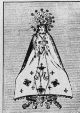
LA VIRGEN DE TORRECIUDAD

Un arqueólogo al ver esta estampa, nos diría que se trata de una imagen mucho más antigua que la Virgen del Plano. Por desgracia, en este antiguo cliché, queda oculto el trono, en que está sentada, y aparece un tanto desfigurada bajo el manto con que la piedad de los fieles ha querido honrarla.