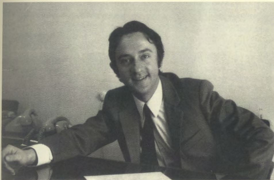
El autor de estas líneas, cuando colaboraba con Vicente y Florentino.

Vicente sabía ya todo sobre el primero, Giner. En "el palomar" guardaba las fichas en que había ido recogiendo con minuciosidad de entomólogo la historia de la España en que nació la Institución Libre de Enseñanza, su primera obra señera. Un socio numerario del Opus Dei participó así, de forma destacada, en el restablecimiento de los cimientos culturales de una sociedad aconfesional como la que se reconoció en la Constitución de 1978. Una sociedad abierta para que cualquiera, y él el primero, pudiera ejercer su derecho a la libre expresión.