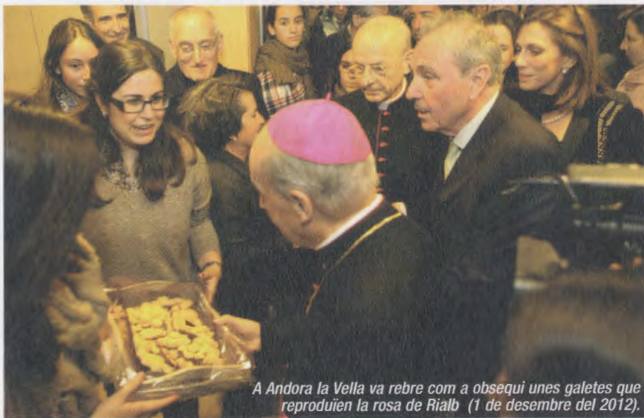
A Andora la Vella va rebre com a obsequi unes galetes que reproduïen la rosa de Rialb (1 de desembre del 2012).

Va continuar: «Els sants, en el seu pas per la terra, deixen un rastre. Els camins que ells han transitat no els hem de considerar com una gesta inimitable o una relíquia per venerar. Déu ha volgut deixar-nos aquestes vides com a exemples propers, perquè ells van veure els mateixos paisatges i van caminar per la mateixa terra que nosaltres veiem i trepitgem cada dia. Considerar els episodis de la seva vida, com estem fent avui, gràcies a l'afecte que teniu per aquest pas de sant Josepmaria per Andorra, ha de servir-nos per imitar els sants en aquelles coses que ens acosten a Déu i als altres. Els pocs dies passats a Andorra per sant Josepmaria contenen moltes lliçons. Els ensenyaments d'un home d'oració, que amb tanta pietat va aprofitar aquesta llibertat de creure i resar que Andorra li va oferir. L'exemple d'un home amant de la llibertat de tots, l'exemple d'un sant que sabia estimar, que sabia perdonar, que sabia agrair.»